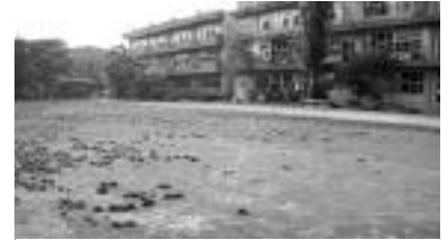
草加小学校(芝生がはがれている)