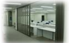
③セキュリティ対策 1階