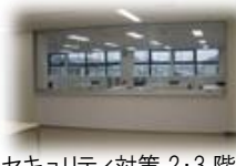
③セキュリティ対策 2・3階