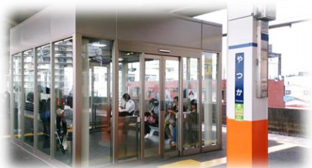
谷塚駅に待合室設置