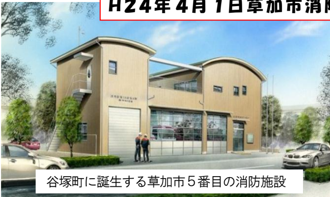
谷塚町に誕生する草加市5番目の消防施設

消防署谷塚ステーションは、草加市南部地域の消防力の強化と、※消防・救急6分体制を作り築きます。